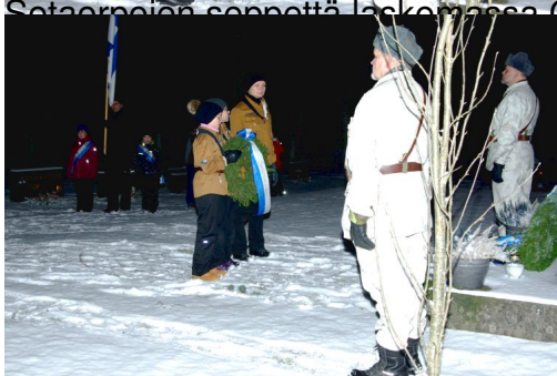
Keurusseudun partiolaisten seppelö.