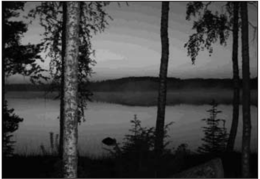
"Järvi on kuin ihmisen peilikuva, joten minkälaisena haluamme itsemme näkyvän?"

Nyt vain jatkamme yhdessä esiselvityksiä ja odotamme innolla ympäristökeskuksen päätöksiä.