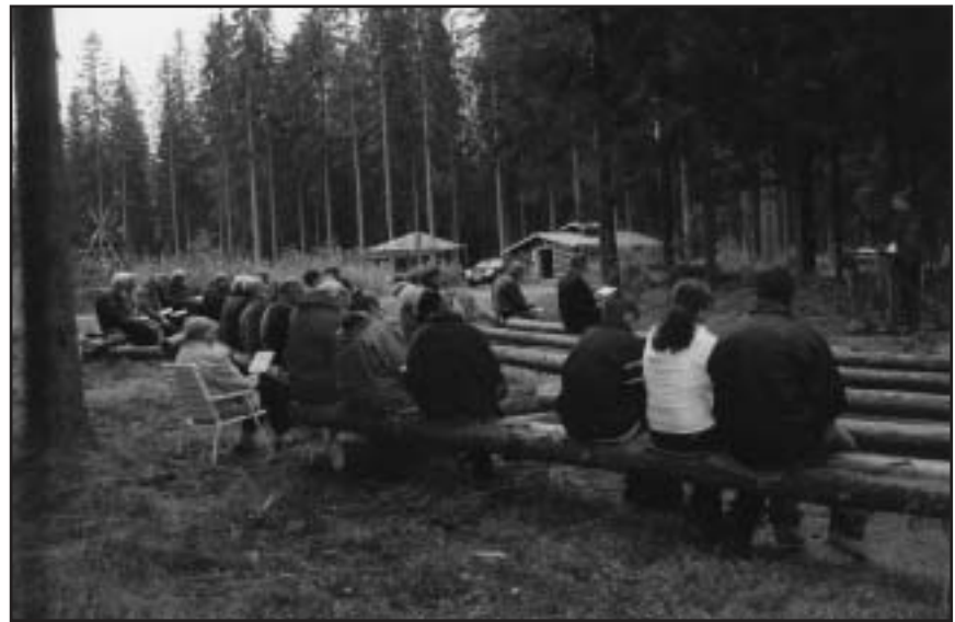
Edessä kirkkosali ja kansaa, taustalla Lapinmaja ja ruokateltta.