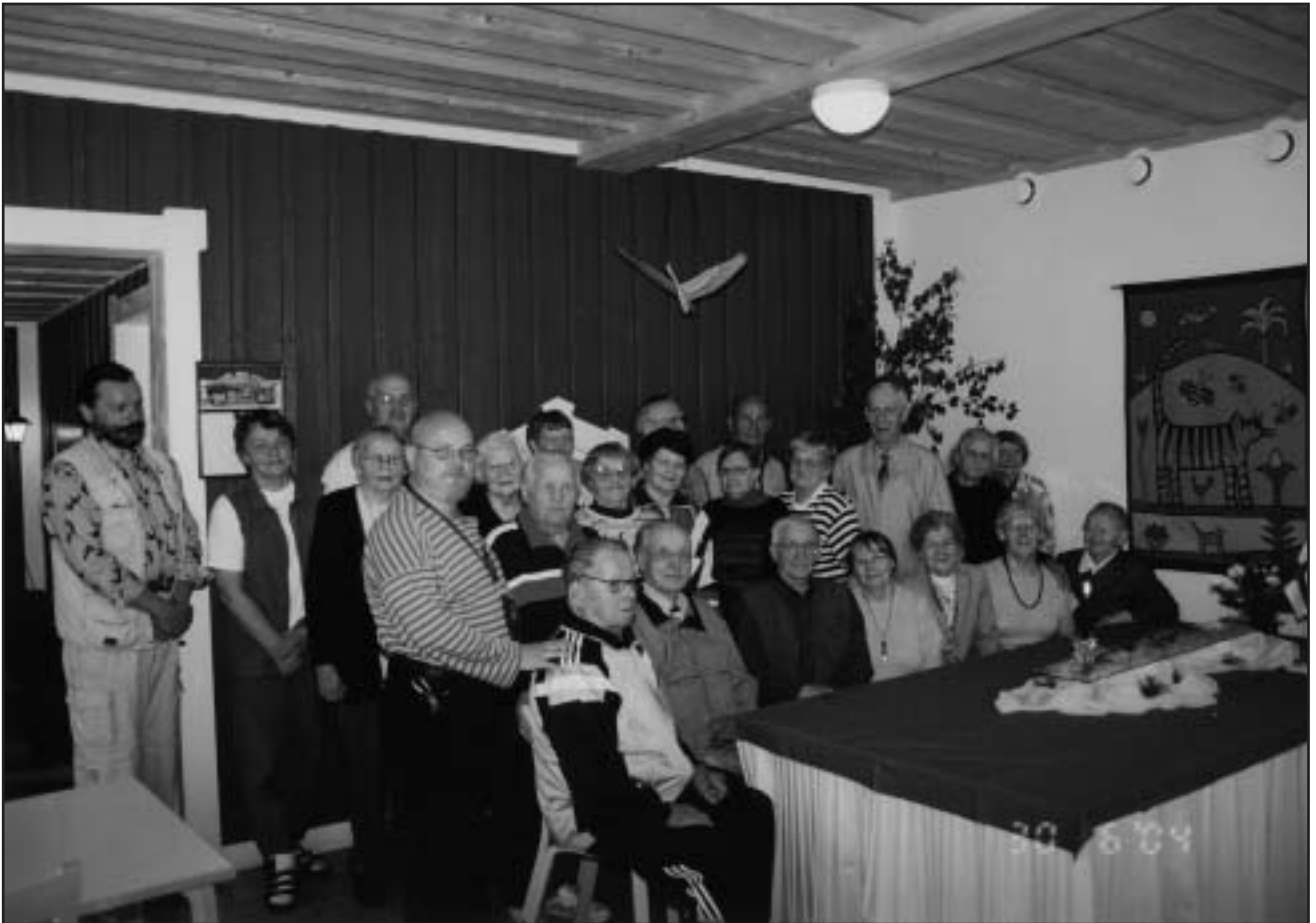
Keski-Suomen piirin Sotaveteraanileirin muistoja Valopilkussa 30.06.-04.07.2004