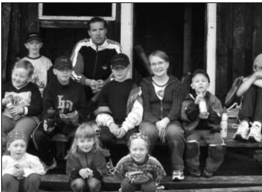
Juomatauolla reippaat urheilijat

7.7-9.7.04 Oli Pihlajaveden ”stadiolla” vilskettä, kun lapset olivat Keuruun kaupungin pitämässä urheilukoulussa. Ikähaitari osallistujilla melkoinen ja asetti vetäjälle haastetta. Koulussa pelattiin jalkapalloa, harjoiteltiin eri lajeja kuten: pesäpallo, kuulantyöntö, keihäänheitto. Pienemmät urheilivat leikinvarjolla, isommat jo oikeasti.