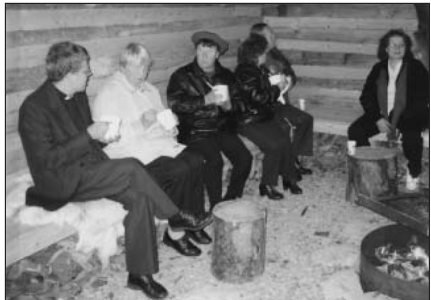
Majasta sisältä, keitolla josta ei sattumia puuttunut.