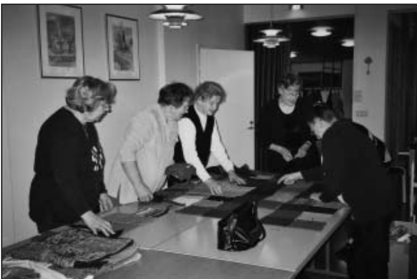
Valmis peitto laskoksiin, uuden suunnittelu vauhdissa.